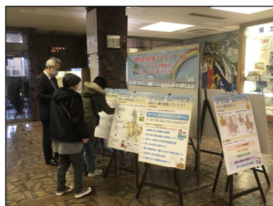
八潮市役所（1階ロビー）