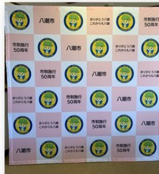
バックボード サイズ：縦228cm×横228cm