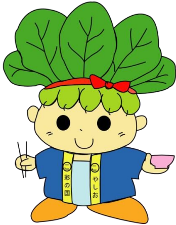
ハッピーこまちゃん®