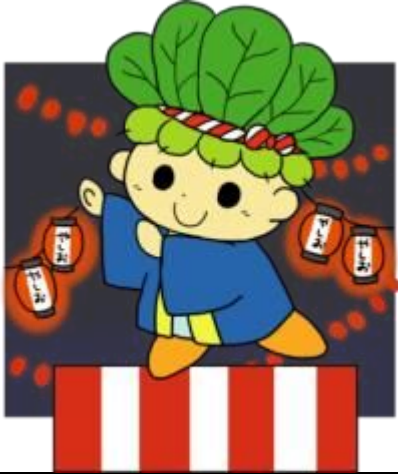
No. 28 (8月)