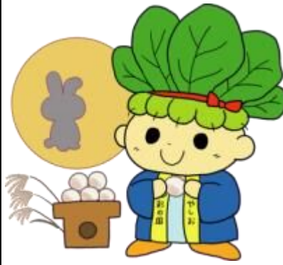
No. 29 (9月)