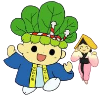
No. 30 (10月)