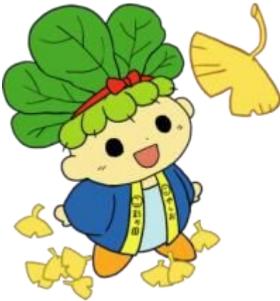
No. 31 (11月)