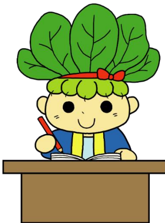
八潮市マスコットキャラクター 「ハッピーこまちゃん」

なお、一般の職員の育児休業期間が変更された場合、任期が延長又は短縮される場合があります。