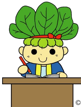
八潮市マスコットキャラクター

なお、一般の職員の育児休業期間が変更された場合、任期が延長又は短縮される場合があります。