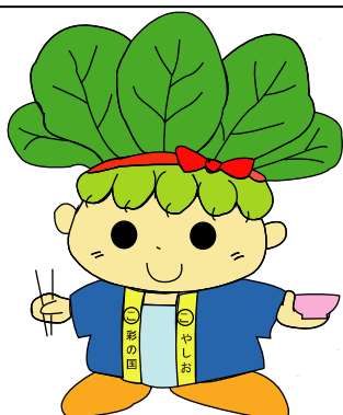
ハッピーこまちゃん®

なお、一般の職員の育児休業期間が変更された場合、任期が延長又は短縮される場合があります。