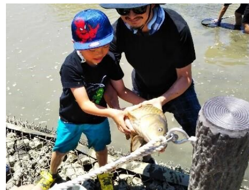
捕まえた大きな鯉