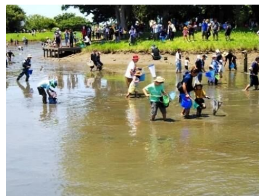
泥に足が取られます