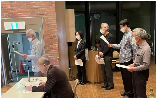
部会報告をする各部長さん

部会報告で「歴史部会」の解散が報告されたことは、残念なことでした。一方、会の最後に「太極拳部会」の皆さんによる「演武」の披露があり、日頃の着実な活動の成果を知ることができました。