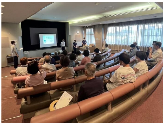
受講者 25 名