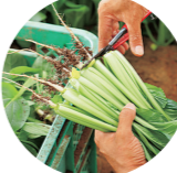
◀小松菜の収穫は一つ一つ丁寧にやっている

しゅんあくり 048-954-4756 MAP P15B4 八潮市の特産・小松菜をはじめ、ほうれんそう、トマト、キャベツなどを栽培、販売している農業法人。農業者のための農業となり、地域の農業を創造している。 ⑧八潮市大瀬256⑨TX八潮駅から徒歩5分