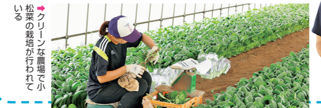
▶小松菜など、八潮ブランドの農作物を作っています