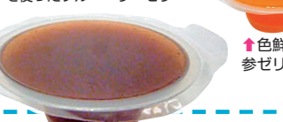
↑色鮮やかな参ゼリーも好評