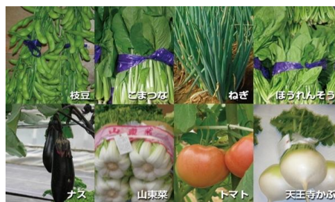
枝豆・こまつな・ねぎ・ほうれんそう ナス・山東菜・トマト・天王寺かぶ

つけていくのは大変です。そこで商業のアイデアやノウハウの力を借り、発信力を強めていけばより良い方向にいくのではないかと考えます。