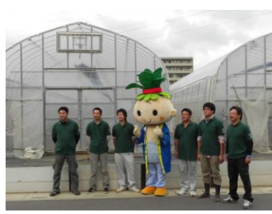
こまちゃんと小松菜の収穫