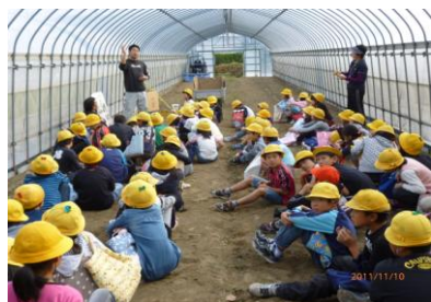
小学校での総合学習 飯山前会長

これらの食生活の変化は豊かさを象徴するもので、農業発展とは、相いれない変化であり、日本農業の停滞の大きな原因をつくつて