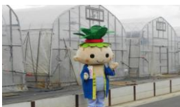
テレビ取材を待っているハッピーこまちゃんです。

・ 散布をすれば洗濯物への付着や住民、特に子供たちの健康を配慮しなければなりません。