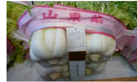
農業祭出品 (山東菜)

各部会の研修会や立毛共進会の開催、小松菜の種子の共同購入、夏野菜の旬採合戦などの体験農業や農業祭への出品など積極的に事業を展開しています。八潮市の農業を考えますと、大消費地に隣接する強みを活かした営農や直売所等を利用した地産地消の推進など、農業が地域に果たす役割をはじめ、農業の持つすばらしさをもっと市民の方に認識していただくことが重要ではないかと考えております。今後とも、消費者の皆様と共に多面的機能を持つ都市型農業の発展を推進してまいりたいと思っております。