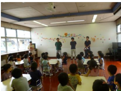
中央保育所で食育活動