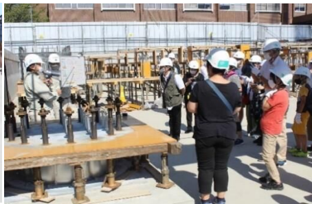
免震装置の説明を受ける様子

10月1日(土)に、新庁舎建設工事の見学会を行い、32名の方が参加しました。工事の説明を受け、免震装置や建物基礎部分を見学し、参加者からは「一つ一つは小さい装置なのに、東日本大震災と同レベルの揺れに耐えられるのはすごい」といった声が寄せられました。