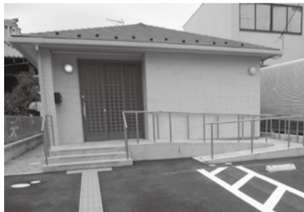
南川崎町会自治会館

市では、「埼玉県ふるさと創造資金」の補助を受けて、コミュニティ活動拠点となる町会・自治会館建設の支援をしています。令和元年度は、南川崎町会と新田町会が会館を建設しました。