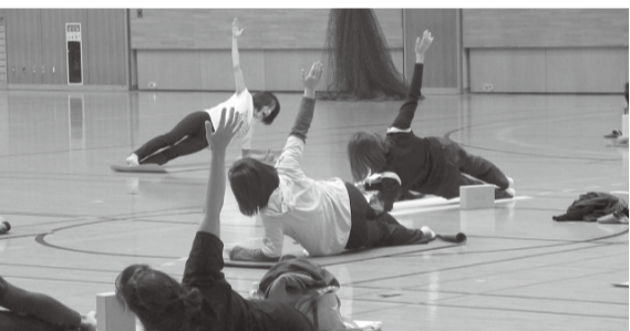
ピラティスの様子

日 5月12日～6月30日(6月2日・9日を除く毎週火曜日・全6回) 午後8時～8時45分 場 エイトアリーナ 対 市内在住・在勤・在学の方 持 室内用運動靴 定 30人(申込順) 費 3,000円