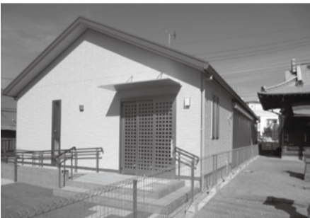
新田町会自治会館