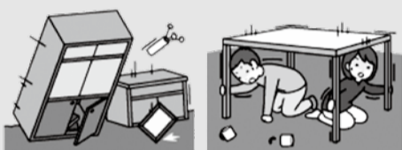
【けがの原因が家具の転倒や落下によるものであった割合】

近年発生した地震で、けがをした原因の多くは、家具などの転倒や落下でした。いつ起きるかわからない大地震に備え、まずは、タンスや食器棚などの家具や冷蔵庫、テレビなどの家電製品を固定して、家の中を安全にしましょう。