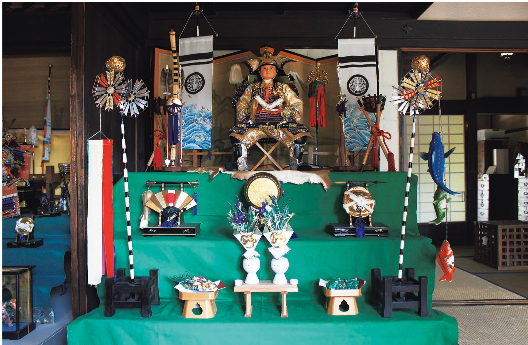
5月9日まで資料館で行われた季節展示「端午の節句」

●今月の主な内容● 1・2面：新型コロナウイルスワクチン接種/子育て世帯生活支援特別給付金/ 3面：八潮市建築物耐震改修促進計画、補助金などの支援制度