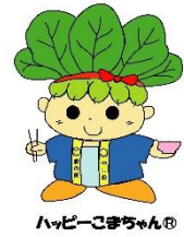
ハッピーこまちゃん®