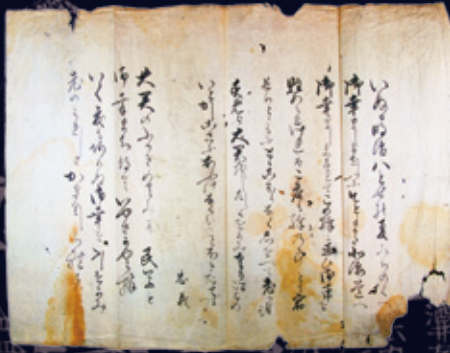
演野弥右衛門献詠歌