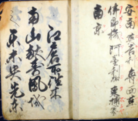
国尽異國名江戸名所手本